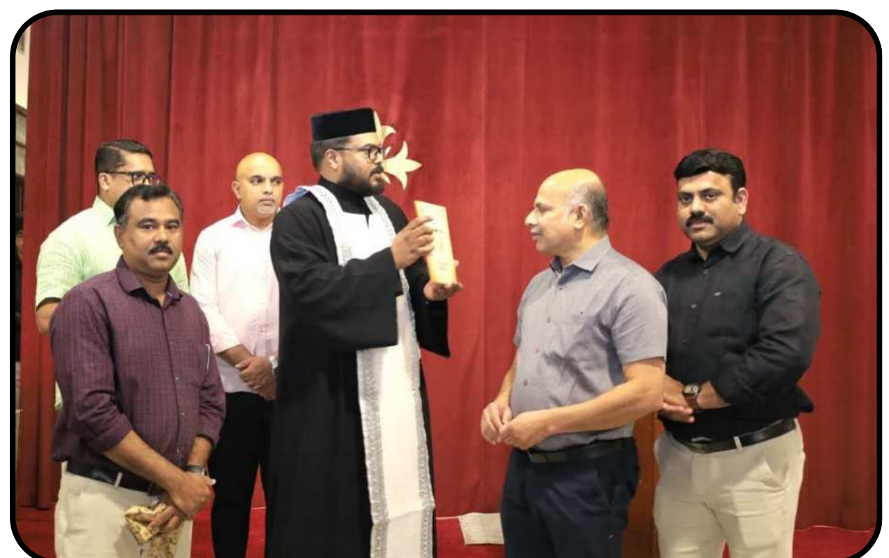
MBYA book revealing "Nombukala Dhyana Chindakal 26/06/2026