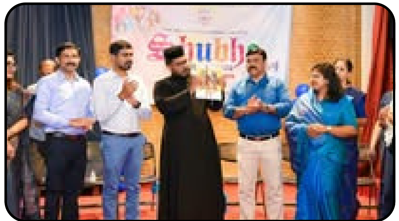
JSVBS SHUBHO 2026 Opening Ceremony 27/06/2026