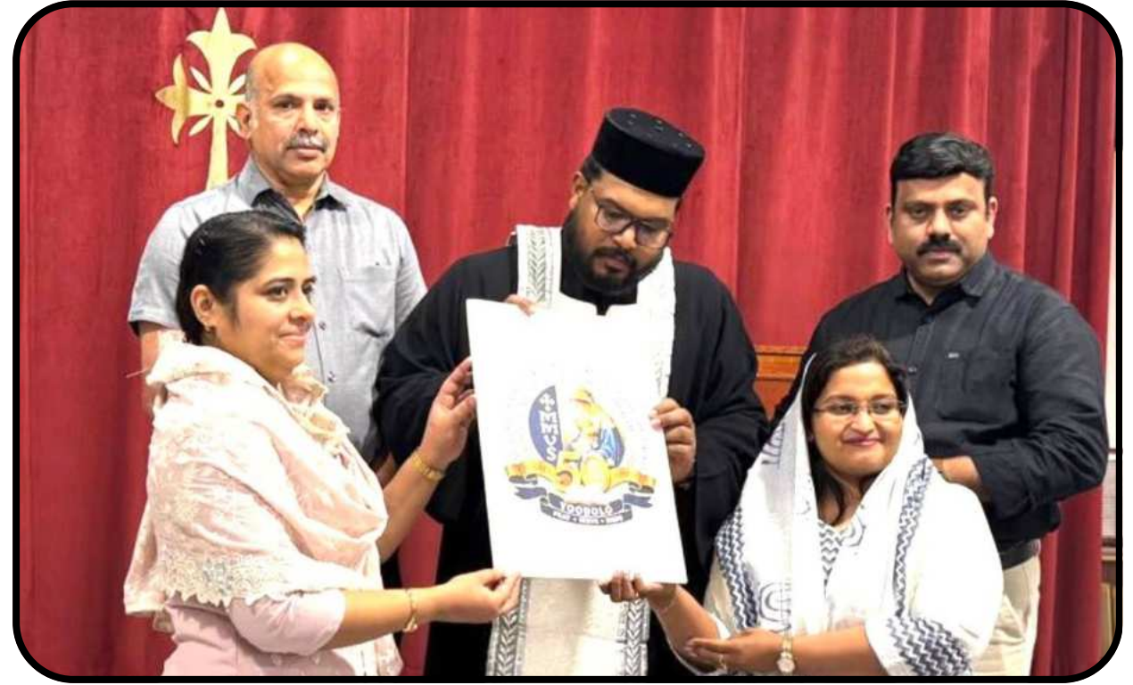
MMVS Jubilee logo unveiling 26/06/2026