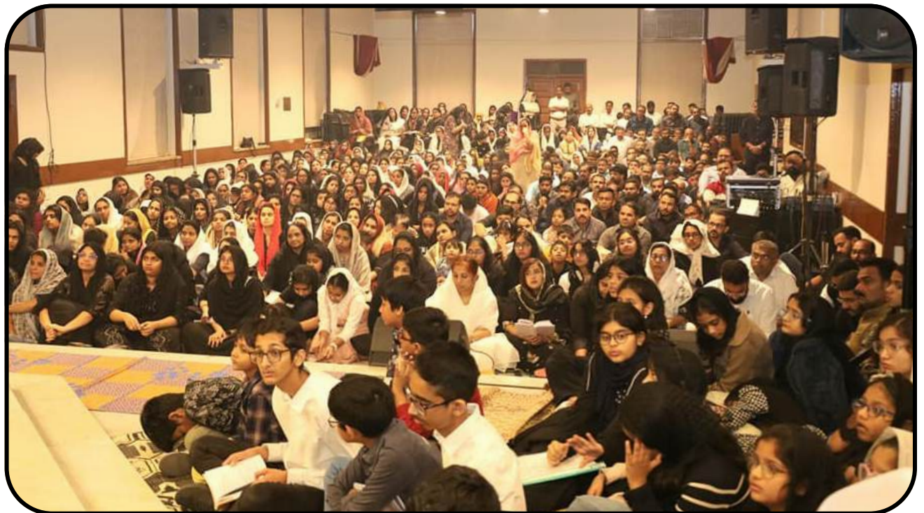
Good Friday Service @ NECK 03/04/2026