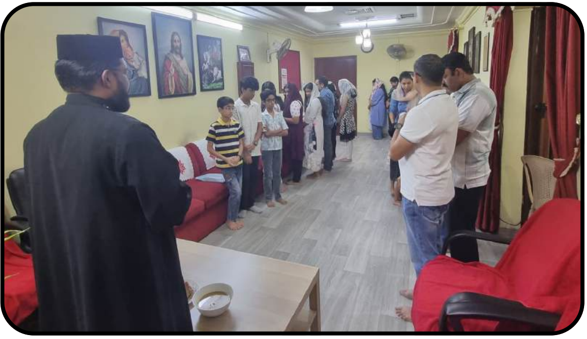
Pesaha Celebration @ Parsonage 02/04/2026