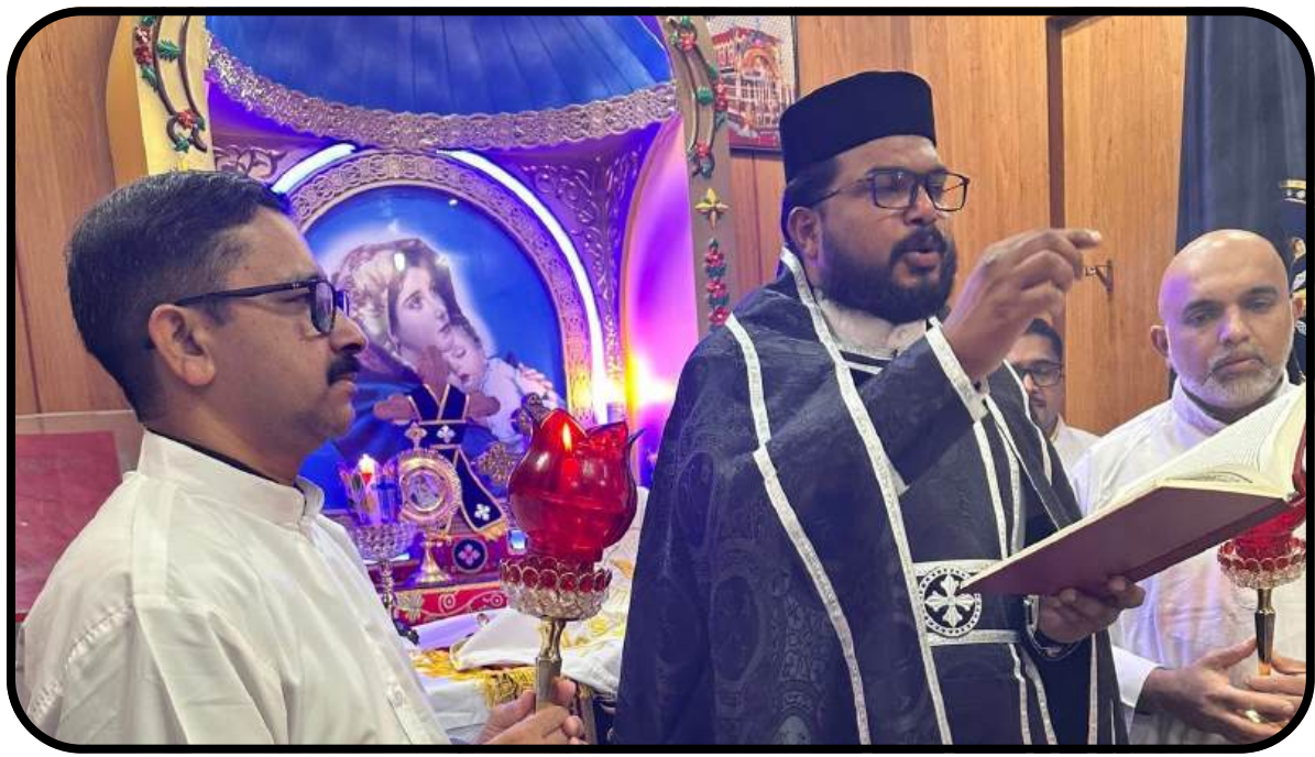
Dhukhasheni Service Parsonage 04/04/2026