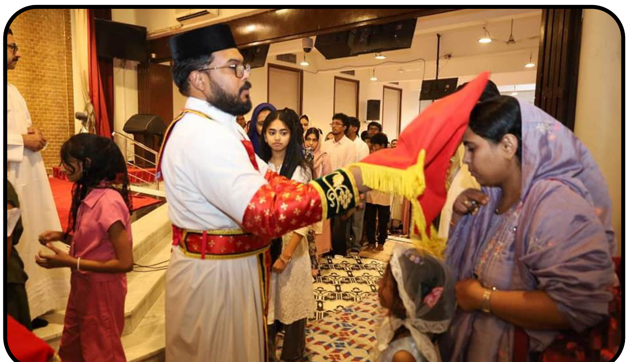
Easter Service @ NECK 04/04/2026