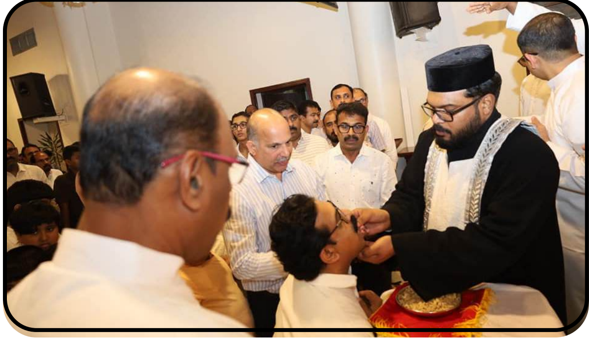
Pesaha Service @ NECK 01/04/2026