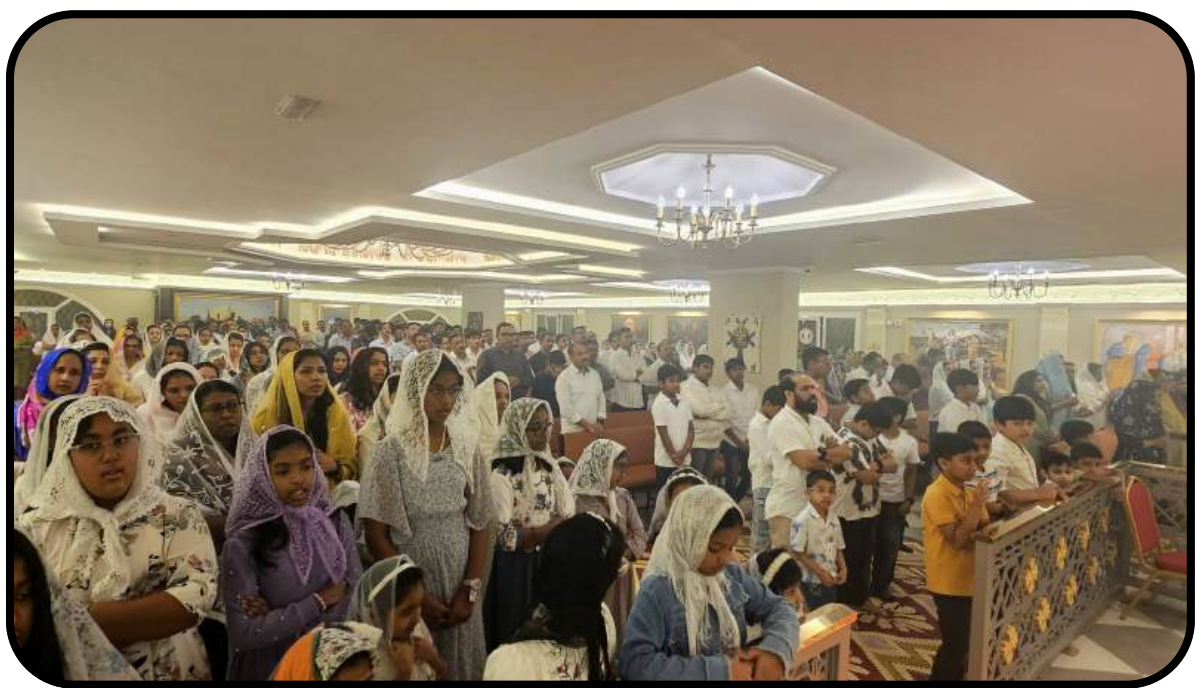
Pesaha Service @ Salwa Armenian Church 01/04/2026