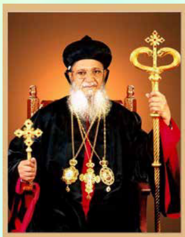
HB Baselios Thomas I “Long Live Catholicose”