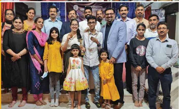
KECF Bible Quiz