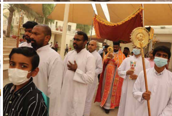
Feast of St. George at NECK