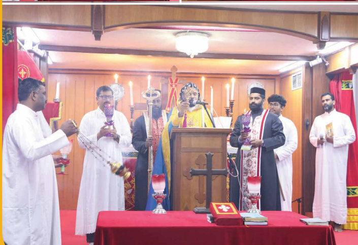
Feast of St. George at Shlomo Abbassiya