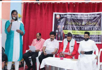
Salmiya Area Prayer Meeting