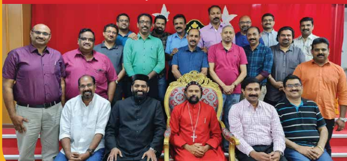
Church Managing Committee 2022