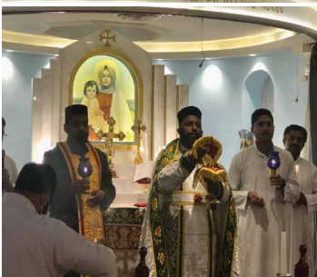
Feast of St. George at Armenian Church