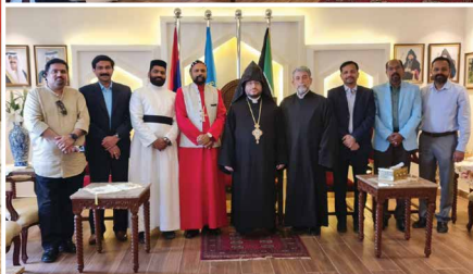
Armenian Church Visit