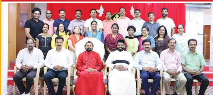
Sunday School Teachers