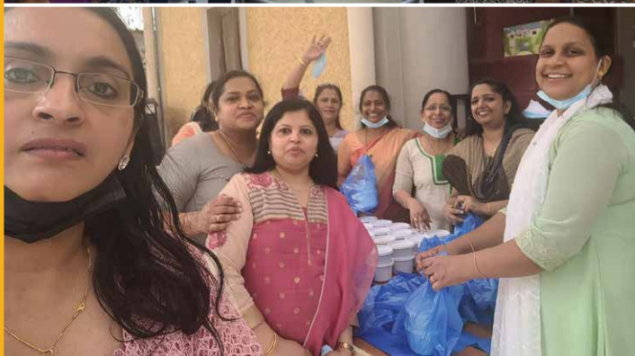
MMVS Breakfast Sale