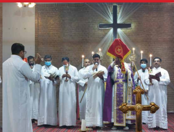
Ascension of Christ