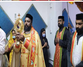
Feast of St. George at Mangaf Prayer Hall