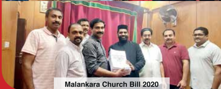
Malankara Church Bill 2020