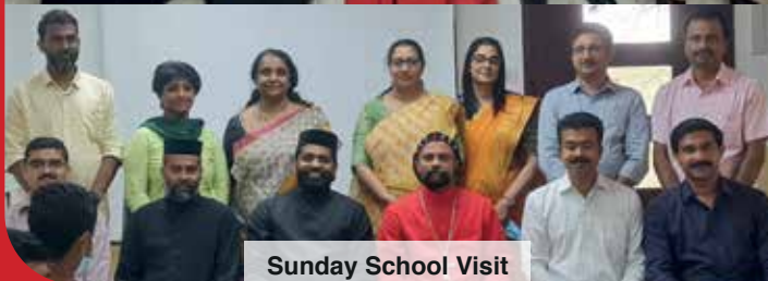
Sunday School Visit