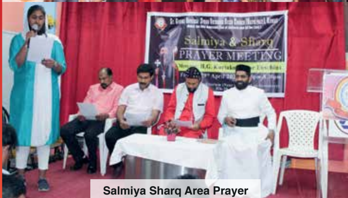
Salmiya Sharq Area Prayer