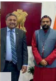
Indian Embassy Visit