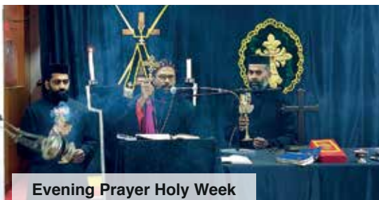
Evening Prayer Holy Week