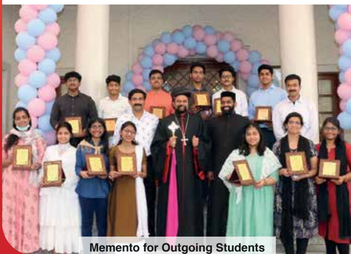
Memento for Outgoing Students