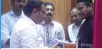
Christmas Get Together in Salmiya